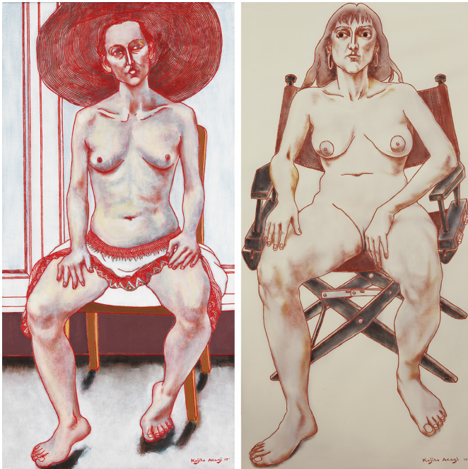
«Gaëlle (ii) & Hélène (Xi)» - Kojiro Akagi Huile sur toile, 100 x 50 cm