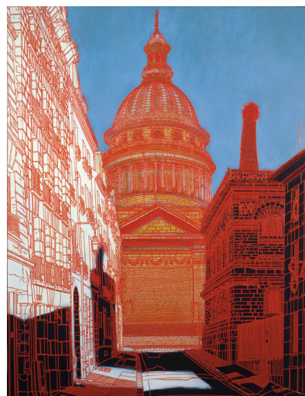
> 2 : Rue Valette, Kojiro Akagi

D'un talent reconnu, véritable « institution - archives graphiques et historiques de Paris », ce peintre étonnant parcourt les rues parisiennes, à la recherche de vues insolites, qu'il traduit dans son style inimitable : mélange de classicisme et d'audace. Ce grand peintre exposé dans le monde entier, fait partie des collections permanentes du Musée Carnavalet, de nombreuses institutions japonaises tels le Musée Royal Ueno ou encore le Musée Préfectoral « Culture de Kyoto », ses œuvres sont également dans les collections de l'Ambassade du Japon, de la Bibliothèque du Trocadéro ou encore à l'Université d'Okayama... Une très belle pièce à l'huile, la façade de la Notre Dame se trouve au Musée de Vatican et cette liste prestigieuse est loin d'être complète.